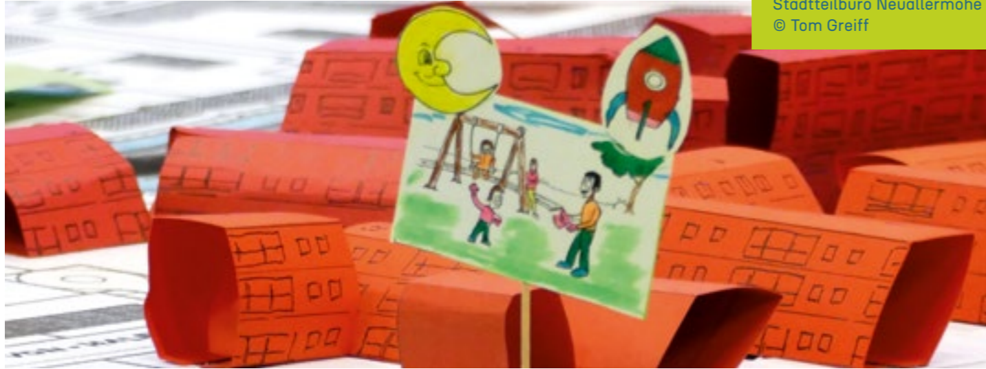
FOTO Ausschnitt aus dem Stadtteilmodell vom Stadtteilbüro Neuallemöhe